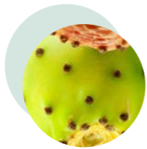
FIGUE DE BARBARIE